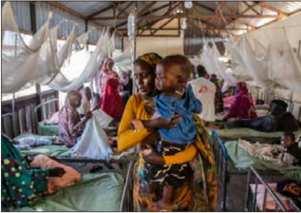
Anaml y mae gwleidyddion sy'n parhau ffoaduriaid yn ystyried pam mae pobl yn ffoi o'u cartrefi. Ers blwyddyn bellach rhwygwyd Sudan gan ryfel cartref chwerw rhwng carfannau milwrol. Mae dros 15,500 o sifiliaid wedi'u lladd a thros 9.5 miliwn wedi'u gorfodi o'u cartrefi. Dim ond 11 mlynedd o heddych a gafwyd yn Sudan ers 1956.