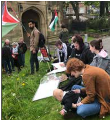
Gwersyll Gaza myfyrwyr Bangor, Mai 2024

Mae'n dymor etholiadau ledled Ewrop a gogledd America. Mae twf etholiadol pleidiau asgell-dde eithafol yn Ewrop yn awgrymu haint ryngwladol ehangach. Yn UDA, llithrodd gwleidyddiaeth Weriniaethol a Democrataidd i mewn i wactod moesol, lle mae safonau dwbl ac, yn affodus, henaint a chelwyddau Trumpaidd yn lleihau hygredded. Gallwn wneud yn well na hyn, ac mae arnom ni hynny i genedlaethau'r gorffennol a'r dyfodol.