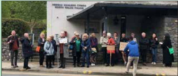
Cefnogi ceiswyr lloches ym Mangor, Calan Mai 2024.

Ar 1 Mai, gyda chefnogwyr cynllun alltudio Rwanda Sunak yn groch o'i blaid, roedd ceiswyr lloches yn cael eu hel i'r ddalfa. Pan ofynnwyd i geisiwr lloches lleol fynd i swyddfa'r heddlu ym Mangor, ymddangosodd grŵp o gefnogwyr y tu allan i'r orsaf ar fyr rybudd. Yn ffodus, ni chafodd ei gadw yn y ddalfa. Mae rhaglen gyfeillgarwch gan grŵp gweithredu Dyma Ni wedi bod yn gweithio gyda ffoaduriaid a cheiswyr lloches yn yr ardal dros y flwyddyn ddiwethaf.