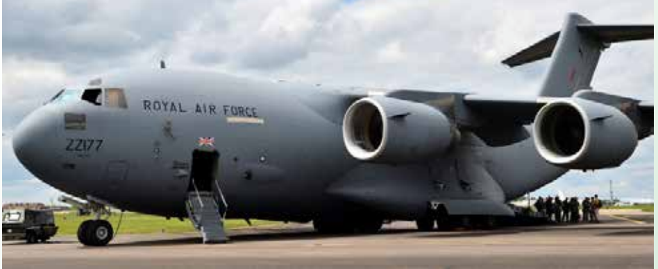
Defnyddir yr ehediadau C-17 i gludo offer a ddefnyddir i gynnal arfau niwclear Prydain