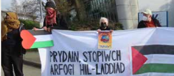
Protest yn Aberporth 2024

Does nemor ddim sôn am y ffaith fod Cymru wedi ei militaroidio i'r carn. Mae'r Weinyddiaeth Amddiffyn yn berchen ar 23,300 hecтар o'n tir, sy'n cynnwys 25 gwersyll milwrol. Mae Ardal Hyfforddi Pontsenni (Mynydd Epynt gynt) yn ychydig dros hanner hyn.