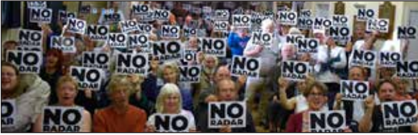
Cofio 1990? Wel, rŷn ni nôl! Neuadd Goffa Solfach dan ei sang, 27 Mehefin 2024. Llyn: DARC

Cychwynnodd ymgyrch PARC yn erbyn DARC ar garlam gyda lansiad digidol ar 29 Mai o'i wefan www.parcagainstdarc.com o ansawdd uchel, sy'n llawn dop o alwadau i weithredu, tudalennau cyfryngau cymdeithasol, deiseb, a chronfa i godi arian. Mae'r wefan yn amlinellu sawl dadl allweddol yn erbyn DARC. Lansiwyd yr ymgyrch gyda lefel