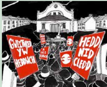
Ymgyrch Heddwch Menywod Cymru 1923

Bydd rhifyn nesaf HEDDWCH yn ymddangos ym mis Rhagfyr 2024.