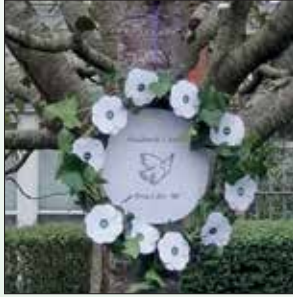
Pabiau gwyn heddwch, Aberystwyth

'Adeiladu mudiad ar gyfer pobl, heddwch a'r blaned, NID elw' oedd uchelgais clodwiw y cyfarfod hwn yn Theatr Soar ym Merthyr Tudful ar 26 Hydref, a fynychwyd gan aelodau CND Cymru. Roedd y pynciau a godwyd yn cynnwys adfywio cymunedol yn seiliedig ar annibyniaeth trwy fentrau cydweithredol, cynlluniau ynni cymunedol a dulliau eraill; hefyd ymgyrch PARC, Palesteina a blaenoriaethau