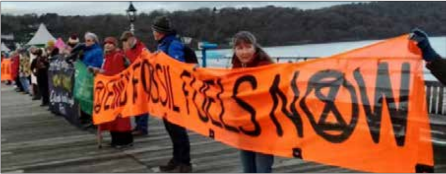
Wedi blwyddyn o lifogydd trychinebus, dyma COP 29 yn ymgynnull yn Baku, Azerbaijan, fis Tachwedd. Nododd gweithredwyr hinsawdd yng Nghymru yr achlysur â baneri ar bier Bangor. Heather Bolton