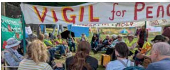
LAP yn cynnal gwylnos a thrafodaeth y tu allan i safle Lakenheath LAP