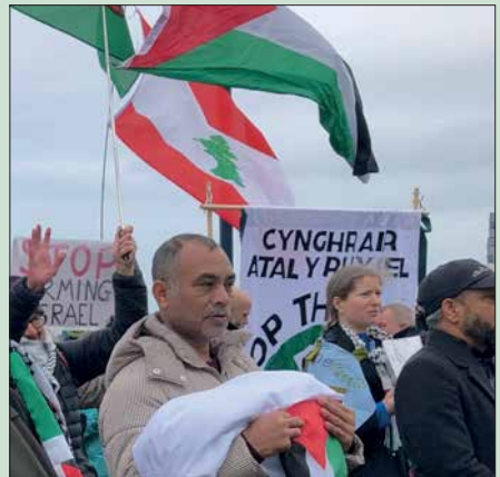
Gorymdaith yn Llandudno, Mis Tachwedd