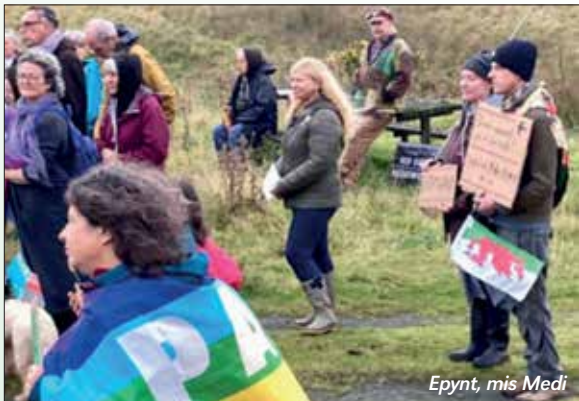
Epynt, mis Medi

Dymchelwyd nifer o'r tai ac adeiladwyd strydoedd i gael ymarfer rhyfela. Plannwyd clystrau o goed hwnt ac