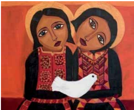
Malak Mattar: Dwy o Ferched Gaza yn Breuddwydio am Heddwch (2020)