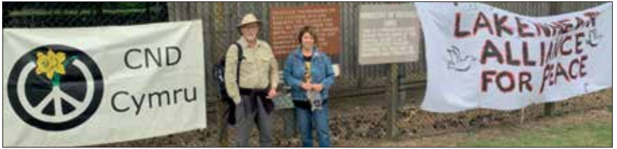
Gweithredwyr o Gymru yn dangos eu cefnogaeth i LAP