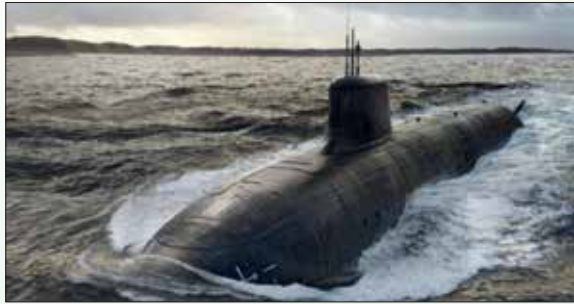
Argraff o'r llong ymosod danfor arfaethedig, SSN AUKUS

Mae DARC, datblygiadau ynni niwclear sifil, a thwf busnesau bach sy'n cyflenwi'r diwydiant amddiffyn ledled Cymru oll yn gysylltiedig, ac mae angen i ni eu herio i gyd.