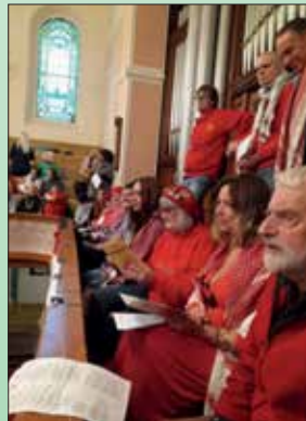
Y Canu Mawr, Y Tabernacl Côr Cochion Caerdydd

Yn yr amserau peryglus hyn, gyda'r bygythiad o wrthdaro sy'n ehangu ar y gorwel, profiad gwirioneddol fywiol oedd bod yn rhan o'r Canu Mawr dros Balesteina ar 16 Tachwedd. Daeth Charlotte Church, Côr Cochion, côr Cynghrair Bryste-Palesteina, Bristol Red Notes, a Songs of Freedom ynghyd o Gymru a