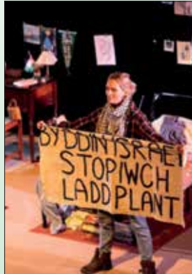
Cofio Rachel Corrie Theatr Cymru