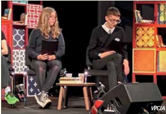
Llysgenhadon Heddwch Ifanc ar Lwyfan yr Eisteddfod Genedlaethol

Gan fod y Babell Heddwch eleni yn ffocws i gymaint o fudiadau, gwelwn y cam cyntaf mewn adeiladu ffrynt unedig yng Nghymru i weithio dros heddwch a chyfiawnder. Mae rhaid i CND Cymru fod yn barod i gefnogi'r cydweithio yma. Gallen ni edrych ar Eisteddfod Wreccsam 2025 fel cyfle i'w dyfa a datblygu.